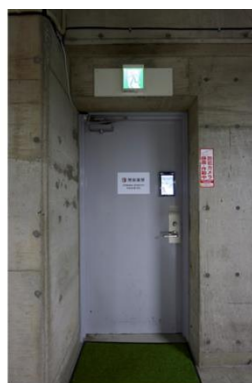
地下駐車場出入口